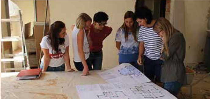
Baustellenbesichtigung mit dem Team des Kindergartens Unterbergla

Die Umbauarbeiten des ehemaligen Gemeindeamtes Unterbergla in eine Kinderkrippe sind bereits voll im Gange. Die Baumeisterleistungen sind bis auf die Estricharbeiten abgeschlossen. Im Kellergeschoß wird eine Pelletsheizung gebaut, welche im nächsten Jahr auch den Kindergarten Unterbergla mitheizen soll. In nächster Zeit werden die Bodenleger- und Malerarbeiten durchgeführt. Danach folgt die Einrichtung und Ausstattung. Im Außenbereich wird ein Spielplatz für die Kinderkrippe neu errichtet. Die Arbeiten laufen auf Hochtouren, um zu einer raschen Fertigstellung zu kommen.