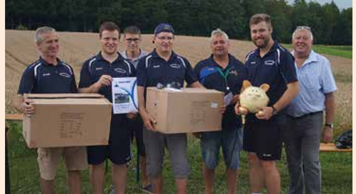
Siegermannschaft Sportlerunde Lasselsdorf mit „Hergo-Glücksschweinchen“