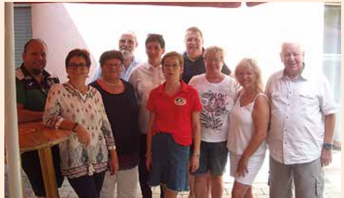
Organisatoren und Mitwirkende beim 10-Jahres-Fest