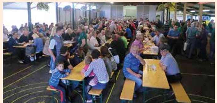
Volles Haus beim Schnitzelsonntag – Alle Fotos: ESV Vochera