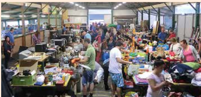
Fetzenmarkt des ESV Vochera

unsere Mannschaften an diversen Turnieren teil und erzielten sehr gute Erfolge. Damit es so bleibt, wird das ganze Jahr, jeden Dienstag um 19.00 Uhr, in der Halle trainiert, wozu wir alle, die Interesse am Stocksport haben, recht herzlich einladen. Weitere Termine sind: Am 28. September findet das Straßenturnier in der „Mandl-Waldarena“ statt. Wir würden uns über die Anmeldung zahlreicher Mannschaften freuen. Für die Mitglieder des ESV findet am 6. Oktober ein Wandertag zum Nassauer City Bier statt. Kleider machen bekanntlich Leute, deshalb hat der ESV vor, sein Team neu einzukleiden, wobei wir uns bei unseren Sponsoren für die finanzielle Unterstützung schon jetzt recht herzlich bedanken möchten.