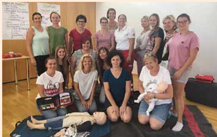
Kindernotfallkurs im Kindergarten Unterbergla