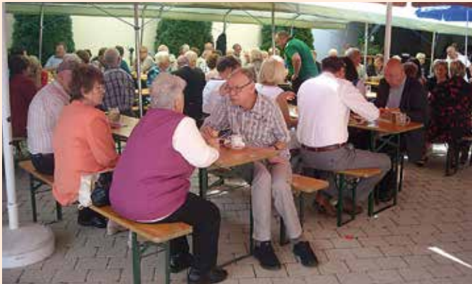
Viele Gäste konnten beim 10-Jahres-Fest begrüßt werden