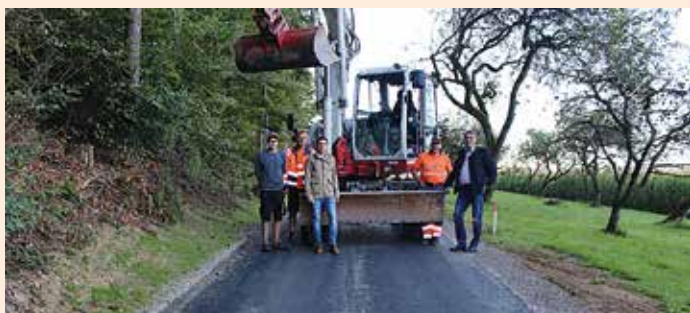
Fertigstellung des Schneiderhanslweges im September

Vor einigen Monaten wurde mit der Sanierung des „Schneiderhanslweges“ in Unterbergla begonnen. Unter der Bauleitung der Abteilung 7 des Landes Steiermark wurden Entwässerungsdurchlässe hergestellt aber auch Schächte betoniert. Die Asphaltierungsarbeiten wurden von der Fa. Swietelsky Baugesellschaft m.b.H. aus Groß St. Florian durchgeführt. Wir danken den Anrainern sowie Verkehrsteilnehmern für die Geduld, die sie für die Behinderungen in diesem Bereich aufgebracht haben.