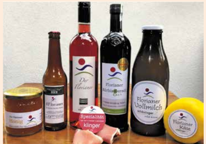
Florianer Produkte

Der inzwischen schon zur Tradition gewordene Adventmarkt der Florianer Wirtschaft ist immer wieder die „Bühne“ für Florianer Besonderheiten. So wurde vor ein paar Jahren sehr erfolgreich die eigene Währung, „Der Laßnitztaler“ eingeführt und im Vorjahr der erste eigene Wein mit der Domäne Müller präsentiert. Heuer werden wir beim Weihnachtsmarkt am 1. Adventwochenende den neuen Jahrgang des Florianer Schilchers und die Herbstfüllungen des Florianer Weiß- und Rotweines präsentieren und verkosten. Auch mit der einen oder anderen Erweiterung der „Florianer“-Produktreihe ist zu rechnen.