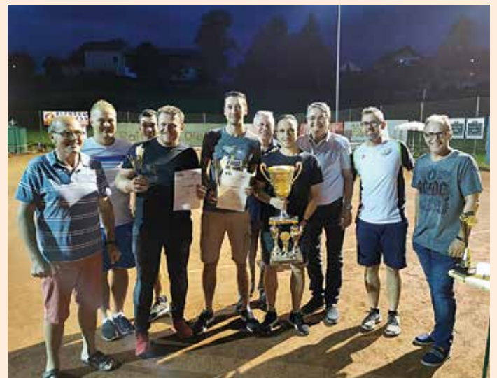
Die Sieger aus den Herrenbewerben