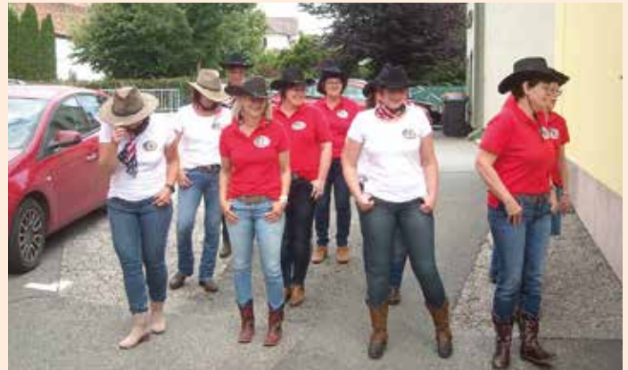
Die Line-Dance-Gruppe aus Groß Sankt Florian

ke. Allen Firmen in und um Groß Sankt Florian sowie unserer Gemeinde danken wir für die großzügige Unterstützung und zahlreichen Spenden.