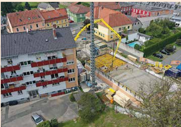
Die Decke des Kellergeschoßes wird betoniert