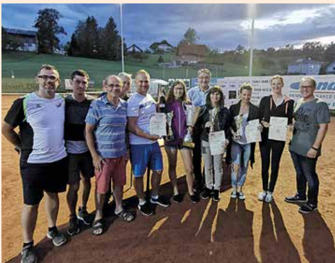
Die Siegerinnen aus den Damenbewerben