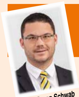
von Jürgen Schwab (Schriftführer)