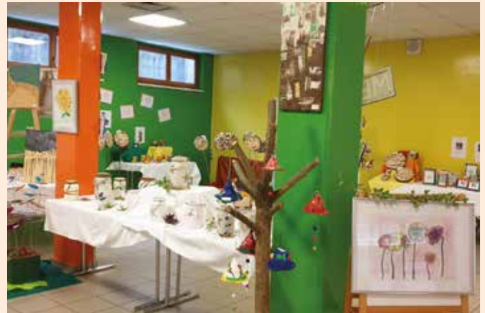
Einblick in die Galerie der tollen Kunstwerke

Begeisterte Zuschauer, stolze Eltern und einzigartige Kinder! Dieses tolle Projekt „Große Kunst in Kinderhand“ wird uns noch lange in Erinnerung bleiben. Mit dem Reinerlös werden neue Bewegungselemente für den Turnsaal angeschafft. Nun starten wir in ein weiteres aufregendes Kindergartenjahr. Ein neues Team, neue Ideen der Umsetzung und ein neues Thema, dessen Inhalte wir den Kindern vermitteln wollen – „ Tauch ein in die Welt der Musik “.