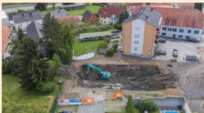
Baugrubenaushub beim neuen Rathaus

Im Juni fand der Baustart unseres Rathausprojektes statt. Nach umfangreichen Abbrucharbeiten diverser Außenanlagen wurde die Baustelle durch die Firma Swietelsky eingerichtet und eine Bautafel aufgestellt. Im Anschluss fanden die Aushubarbeiten statt. An der Baugrubensohle wurde ein Bodenaustausch durchgeführt. Ende Juli wurde mit den Arbeiten an der Bodenplatte, wie Dämmung, Bewehrung und Schalung begonnen. Das Kellergeschoß konnte Ende August fertiggestellt werden, aktuell wird gerade am Rohbau im Erdgeschoß gearbeitet. Die Fertigstellung des Rohbaues ist mit Oktober geplant. Ein Dank ergeht an die umliegenden Anrainer sowie an die Bewohner des Postwohnhauses für ihr Verständnis.