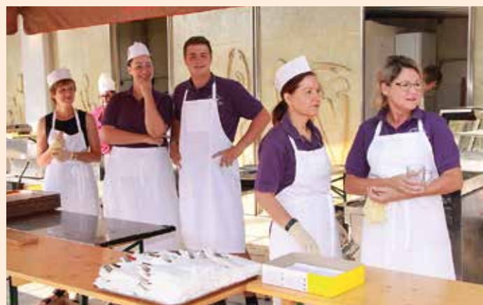
Die fleißigen Helfer beim Marktfest