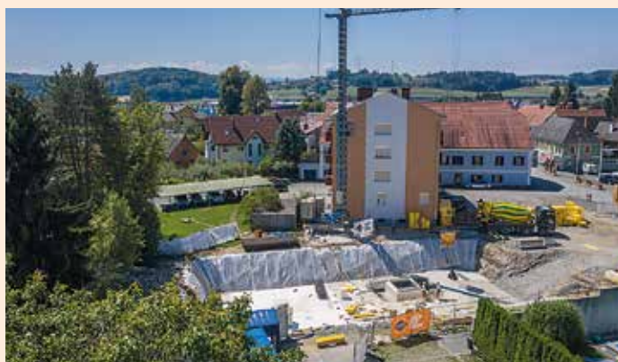
Firma Swietelsky beim Betonieren