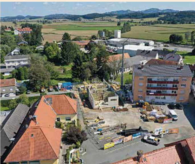
Das Erdgeschoß in der Entstehungsphase