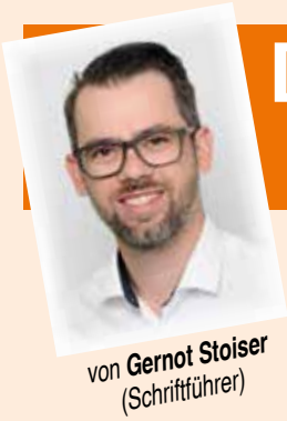
von Gernot Stoiser (Schriftführer)