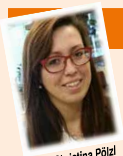
von Christina Pölzl (Pressereferentin)