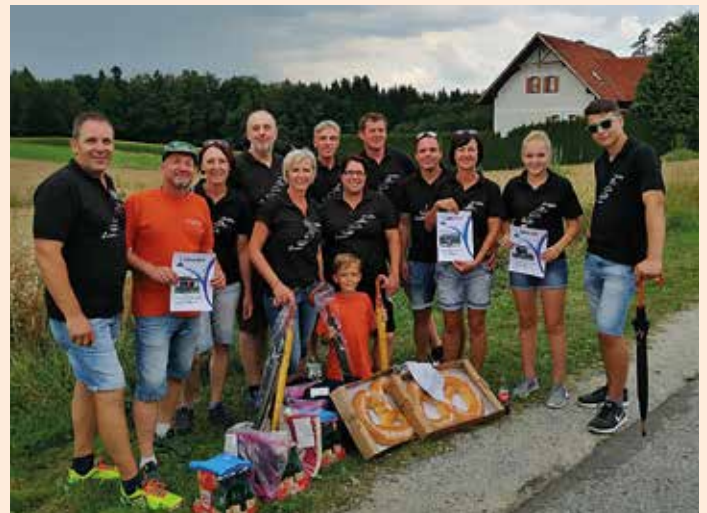
Erfolgreiche Teilnehmer des Straßenturnieres

Heuer nahmen wir beim Straßenturnier des ESV Tanzelsdorf als am stärksten vertretener Verein mit drei Mannschaften teil, wo wir mit unserem Motto „Spaß am Sport“ bewiesen haben, dass wir auch in anderen Sportarten aktiv sind. Am 2. Oktober startet wieder unser beliebtes Hallentraining in der Florianihalle für Jung und Junggebliebene.