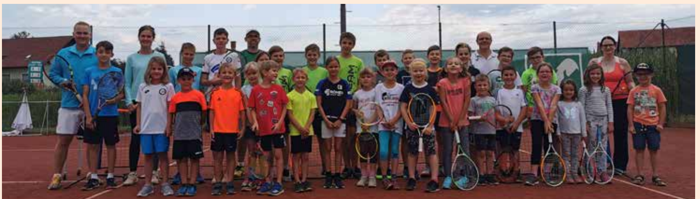
Kinder- und Jugendtenniskurs in Michlgleinz