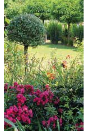
Schaugarten in Tobis bei Preding

Nähere Informationen erhalten Sie im Marktge-meindeamt oder auf der Homepage der Marktge-meinde Groß Sankt Florian.