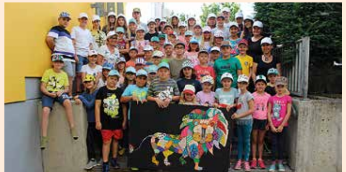
Gruppenfoto bei der Florianihalle

Afrika entführt. Die Darbietungen der Akrobatik-, Mal-, Theater, Tanz- und Skulpturengruppe standen unter diesem Motto und die Kinder präsentierten ihre Werke. Begleitet von afrikanischen Klängen zeigte die Malgruppe ihre Kunstwerke, die Skulpturengruppe spielte auf selbstgebastelten Trommeln zum Tanz des „Riesenlöwen“, die Akrobatikgruppe hatte ihren Auftritt in Tierkostümen und ein selbstkreatives Theaterstück wurde von der Theatergruppe dargeboten. Eine Tanzeinlage der Tanzgruppe rundete die gelungene Veranstaltung ab. Bei den Firmen Malerbetrieb Hammer und Sägewerk Reiterer möchten wir uns besonders bedanken, da sie alle Materialien kostenlos zur Verfügung gestellt haben. Wir bedanken uns für die Teilnahme und freuen uns auf die 8. Kreativwoche im August 2020.