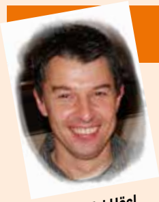
von Kaj Hösl (Schriftführer)