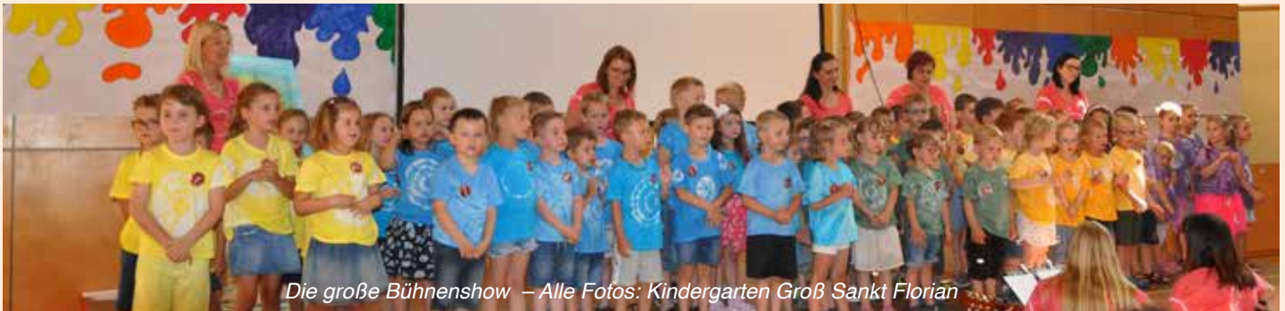
Die große Bühnenshow

Begeisterte Zuschauer, stolze Eltern und einzigartige Kinder! Dieses tolle Projekt „Große Kunst in Kinderhand“ wird uns noch lange in Erinnerung bleiben. Mit dem Reinerlös werden neue Bewegungselemente für den Turnsaal angeschafft. Nun starten wir in ein weiteres aufregendes Kindergartenjahr. Ein neues Team, neue Ideen der Umsetzung und ein neues Thema, dessen Inhalte wir den Kindern vermitteln wollen – „ Tauch ein in die Welt der Musik “.