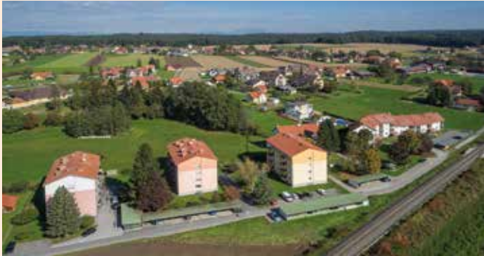
Die Gemeindewohnhäuser in der Sonnenstraße

Zu vergeben ist eine Wohnung in der Sonnenstraße 23c mit zwei Zimmern, Küche, Bad, WC, Vorraum inklusive Abstellnische, Loggia, Kellerabteil und PKW-Abstellplatz mit etwa 72 m 2 im Erdgeschoß.