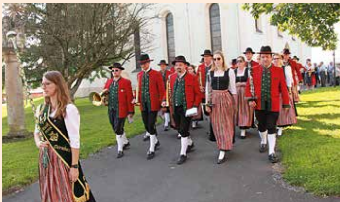
Musikverein Dörnbach (OÖ)

Es würde uns freuen, Sie am 07. Dezember um 20.00 Uhr bei unserem Wunschkonzert in der Florianihalle begrüßen zu dürfen.