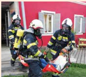
Bergung einer vermissten Person