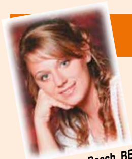
von Alexandra Posch, BEd (Pressereferentin)