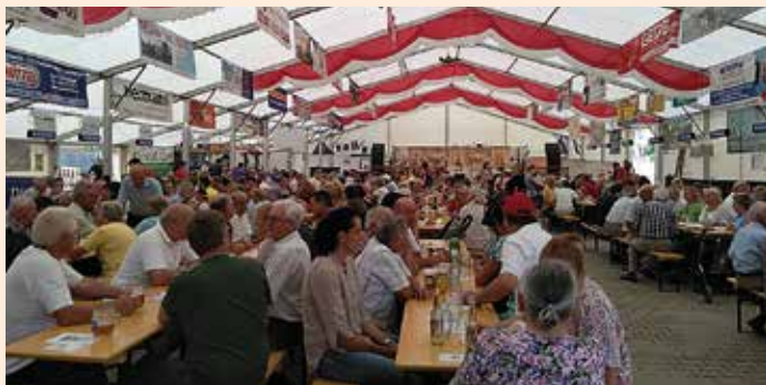
Toller Besuch beim Frühschoppen mit „Die Pagger Buam“