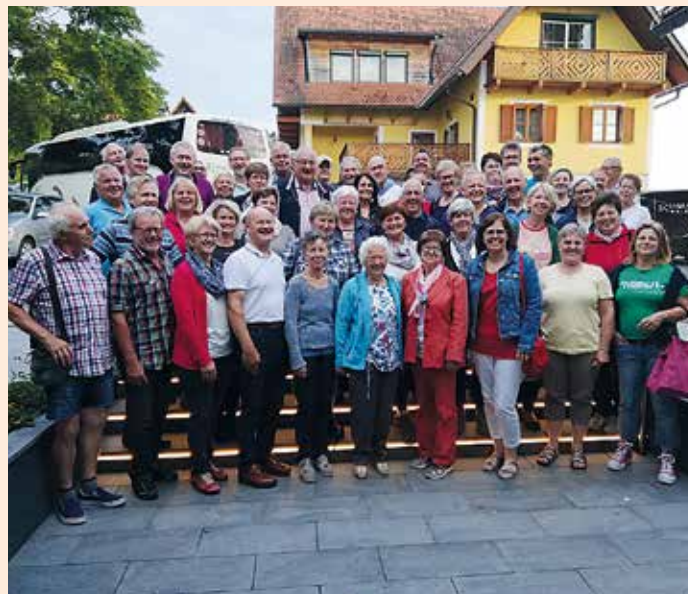
Geselliger Abschluss im Buschenschank Schmölzer

ser. Alle Reisetilnehmer erlebten drei schöne Tage und freuen sich schon auf den nächsten Gemeindeausflug im Sommer 2020!