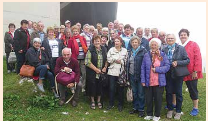
Fahrt ins Blaue auf die Petzen