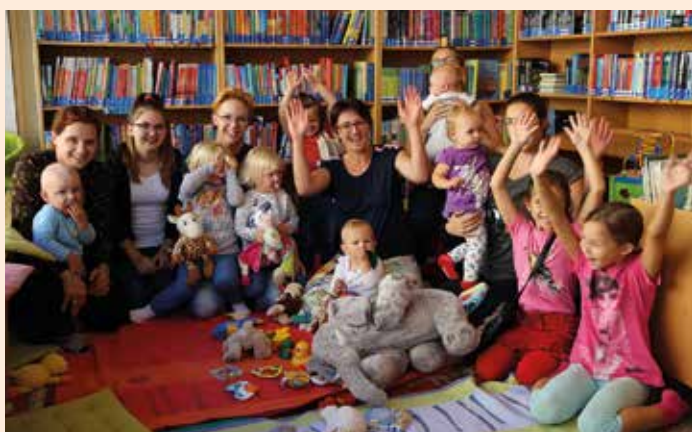
Viel Spaß für Groß und Klein beim Buchstart-Frühstück – wir freuen uns schon auf die kommenden Bücherzoo-Vormittage

Sparmarkt Puntigam , belohnt. Außerdem gab es beim Sommerlesepass-Abschlussfest noch viele schöne Preise zu gewinnen. Bereits Anfang September fand heuer zum 2. Mal das Buchstart-Frühstück statt. Alle frischgebackenen Eltern waren mit ihren Kleinen in der Bücherei zu einem gemütlichen Frühstück eingeladen. Man konnte sich über die Bücherei und ihre Veranstaltungen informieren und im breiten Angebot für die Kleinsten, aber auch für die Eltern stöbern. Außerdem gab es für jedes „neue“ Kind eine Buchstart-Tasche mit dem ersten Buch, einer Jahreskarte für die Bücherei und vielen Informationen. Diese Taschen werden vom Land Steiermark und der Gemeinde Groß Sankt Florian gesponsert. Gerade die Kleinen genießen die gemeinsame Vorlesezeit und finden es spannend die Welt in Büchern zu entdecken.