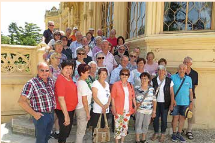
4-Tages-Ausflug der Unterbergla Senioren