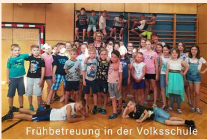
Frühbetreuung in der Volksschule

A uch in diesem Schuljahr gibt es für die Kinder der Volksschule die Möglichkeit der professionellen Frühbetreuung. Diese wird ab 06.45 Uhr bis 07.45 Uhr im Turnsaal der Volksschule abgehalten und von der Gemeinde kostenlos angeboten. Die Frühbetreuung findet ausschließlich an Schultagen statt und kann von den Buskindern genutzt werden (Ausnahme: eine Notsituation oder Kinder, deren Eltern schon frühzeitig zur Arbeit müssen). In der ersten Schulwoche konnten die Eltern die Kinder dazu anmelden. Die Aufsichtspflicht übernehmen in dieser Zeit die Erzieherinnen Eveline Klug und Renate Maissenbichler. Sie bieten den Kindern verschiedene Aktivitäten wie Sport, Lesen und Ruhephasen an. Die Erfahrungen der letzten Jahre haben uns gezeigt, dass sich die Mädchen und Jungen sehr wohl fühlen und gerne die Frühbetreuung besuchen.