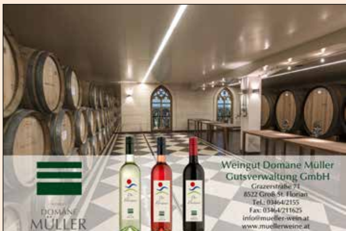
Weingut Domäne Müller Gutsverwaltung GmbH Grazerstraße 71 8522 Groß St. Florian Tel.: 03464/2155 Fax: 03464/21625 info@mueller-wein.at www.muellerweine.at

Für alle jungen Familien, die nicht am Buchstart-Frühstück teilnehmen konnten, gibt es jeden 1. Mittwoch im Monat um 09.00 Uhr die Möglichkeit, den Bücherzoo zu besuchen und sich dort auch die Buchstart-Tasche zu holen.