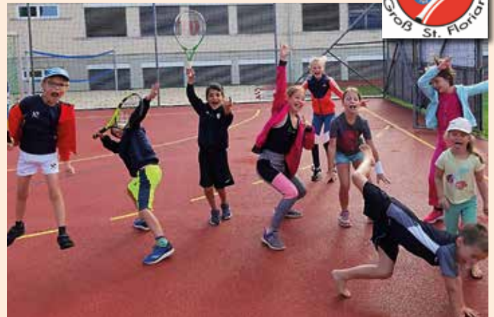
Ausgezeichnete Stimmung beim Jugendcamp des UTV