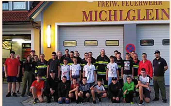
Monatsübung mit der Abschnittsfeuerwehrjugend.

wieder unsere Haussammlung im ehemaligen Gemeindegebiet von Unterbergla am Samstag, den 12.10.2019 stattfinden.