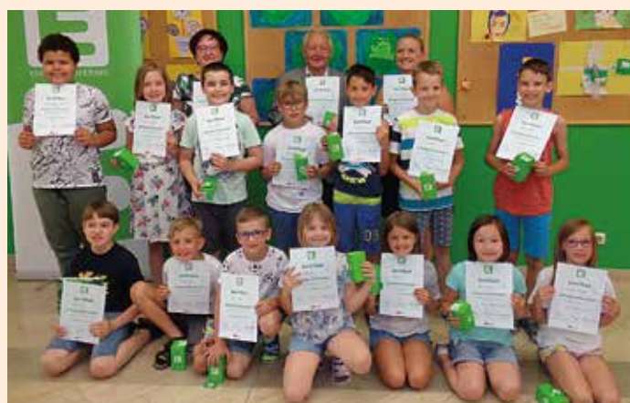
Stolze Besitzer des Energie-Zertifikates