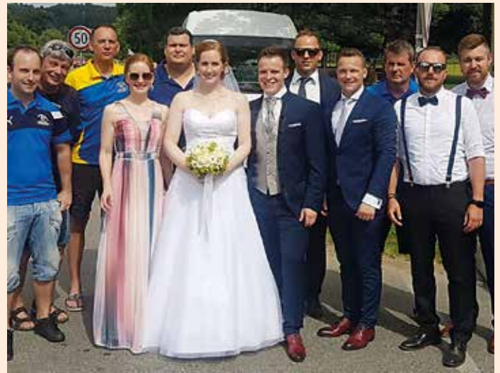
Herzlichen Glückwunsch zur Hochzeit