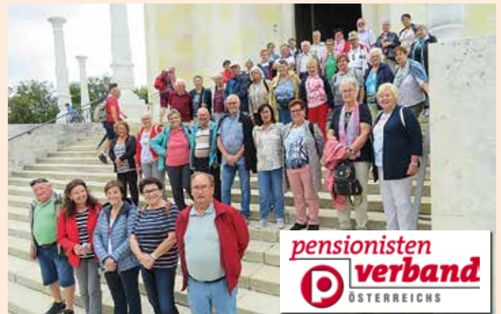
Die Ausflügler auf der Stiege zur Befreiungshalle – (Foto: Pensionistenverband Groß Sankt Florian)

Voralpenkreuz ging es weiter nach Landshut, wo im Gasthof „Isarklause“ das Mittagessen kredenzt wurde. Die Stadtführung am Nachmittag musste wegen Schlechtwetters leider abgesagt werden. Genächtigt wurde im Hotel „Weingarten“ in Haibach. Am zweiten Tag ging es ins Tal der Kelten nach Kelheim. Von dort fuhr man per Schiff Donau aufwärts, vorbei am Donaudurchbruch bis zum Kloster Weltenburg, wo sich die älteste Brauerei Deutschlands befindet. Nach dem Mittagessen in der Klosterschenke besichtigten wir die Befreiungshalle (eingeweiht 1863) am Michelsberg. Der Monumentalbau wurde von König Ludwig dem I. zum Gedenken an die Napoleonischen Befreiungskriege errichtet. Am dritten Tag war Straubing das Ziel. Die Herzogstadt hat eine Jahrtausend alte Geschichte mit vielen Museen und Kirchen. Die bekannteste ist die Basilika St. Peter. Nach einer interessanten Stadtführung wurde im „Bayrischen Löwen“ zu Mittag gegessen. Am Nachmittag besichtigten wir das „Haus am Kopf“ in Maibrunn bzw. die