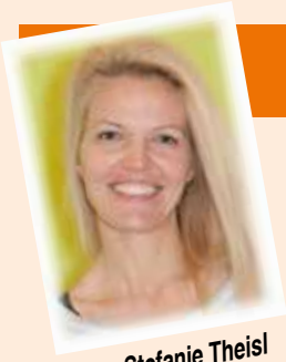
von Stefanie Theisl (Leiterin)