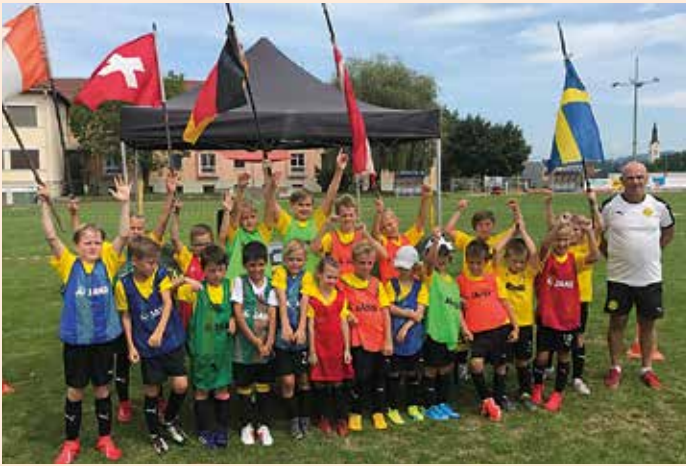
Die begeisterten Kids vom Sommercamp