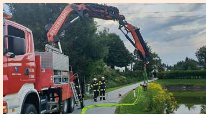
Übung beim Löschteich in Petzelsdorf