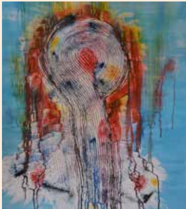
Das Gemeinschaftskunstwerk aller Bildungseinrichtungen für das neue Rathaus

unterhielten die zahlreichen Gäste mit einem musikalischen Bühnenprogramm. „Kunterbunt in allen Regenbogenfarben!“ Als besondere Überraschung des Abends entstand direkt auf der Bühne ein modernes Kunstwerk. Ein gemeinschaftliches Bild, das unserem Bgm. Alois Resch als Dank für die finanzielle Unterstützung für das neue Rathaus überreicht wurde.